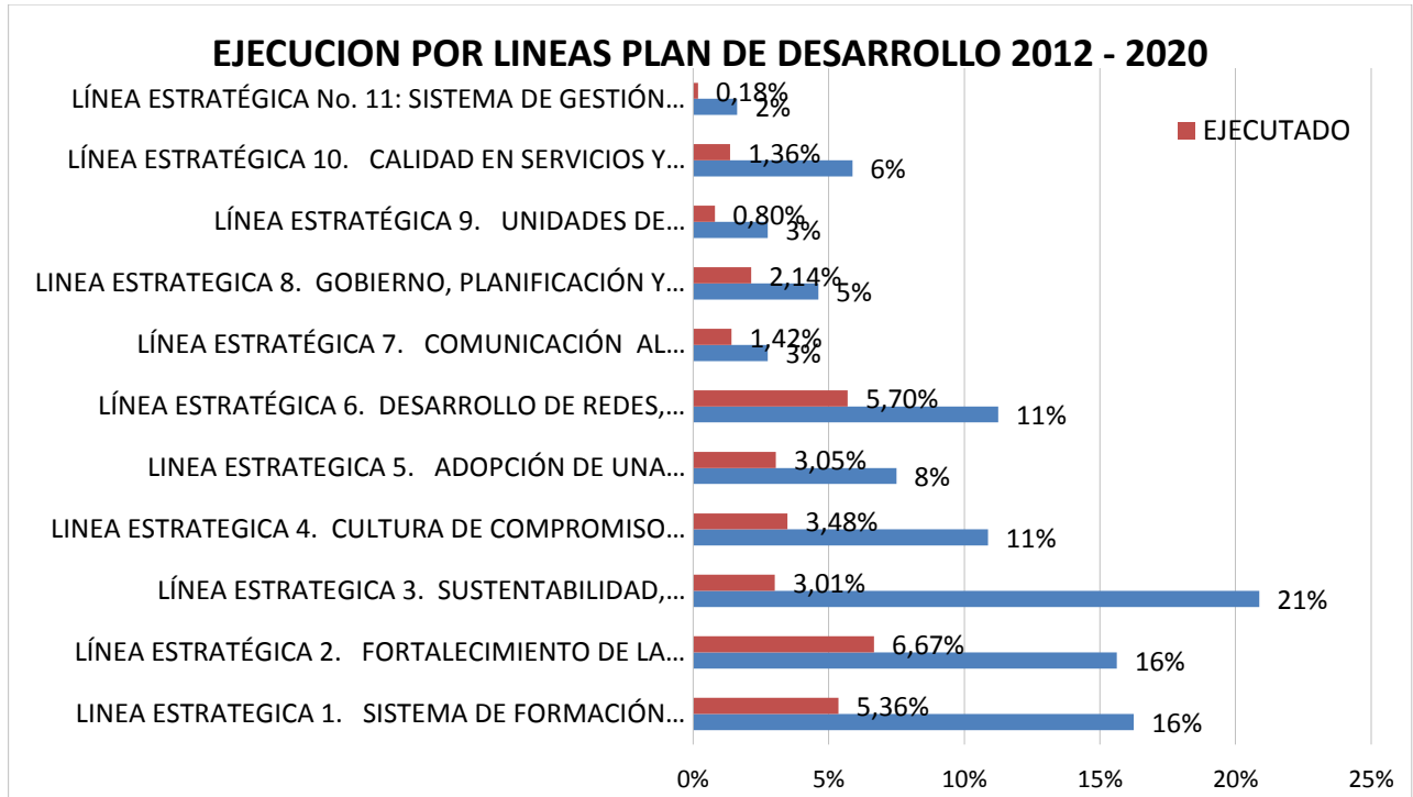
Grafica 1: Oficina de Planeación 2017

En la gráfica se puede observar el comparativo de los valores propuestos como metas (barras azules) y los resultados de la ejecución acumulada (barras rojas); transcurrido 4 años del Plan de Desarrollo 2012-2020, la ejecución del mismo, no alcanza al 505 que debería llevar, faltando para los 4 años restantes una ejecución del 66,83% como lo evidencia la gráfica siguiente: