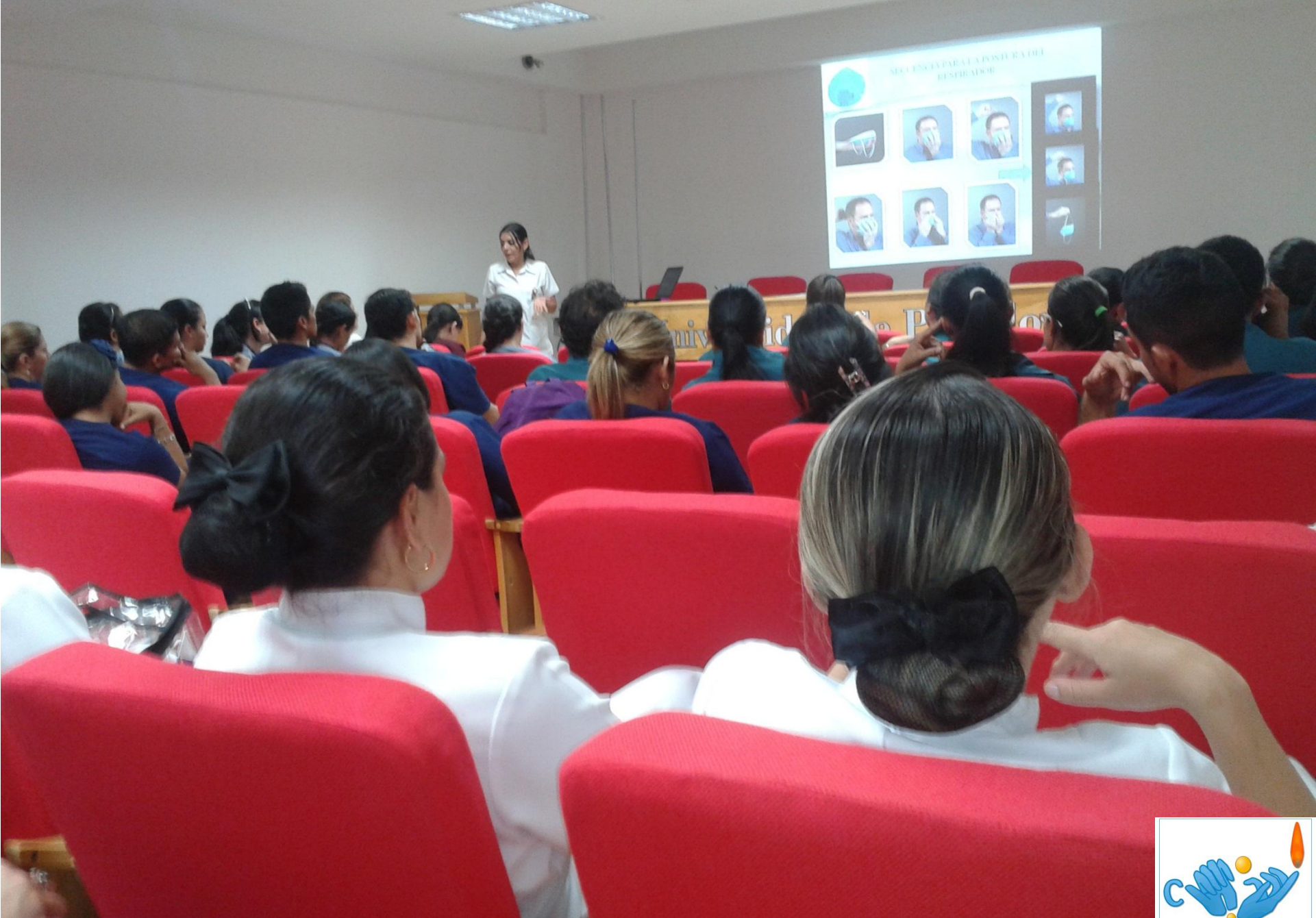
Inducción del Hospital Universitario Erasmo Meoz (HUEM)