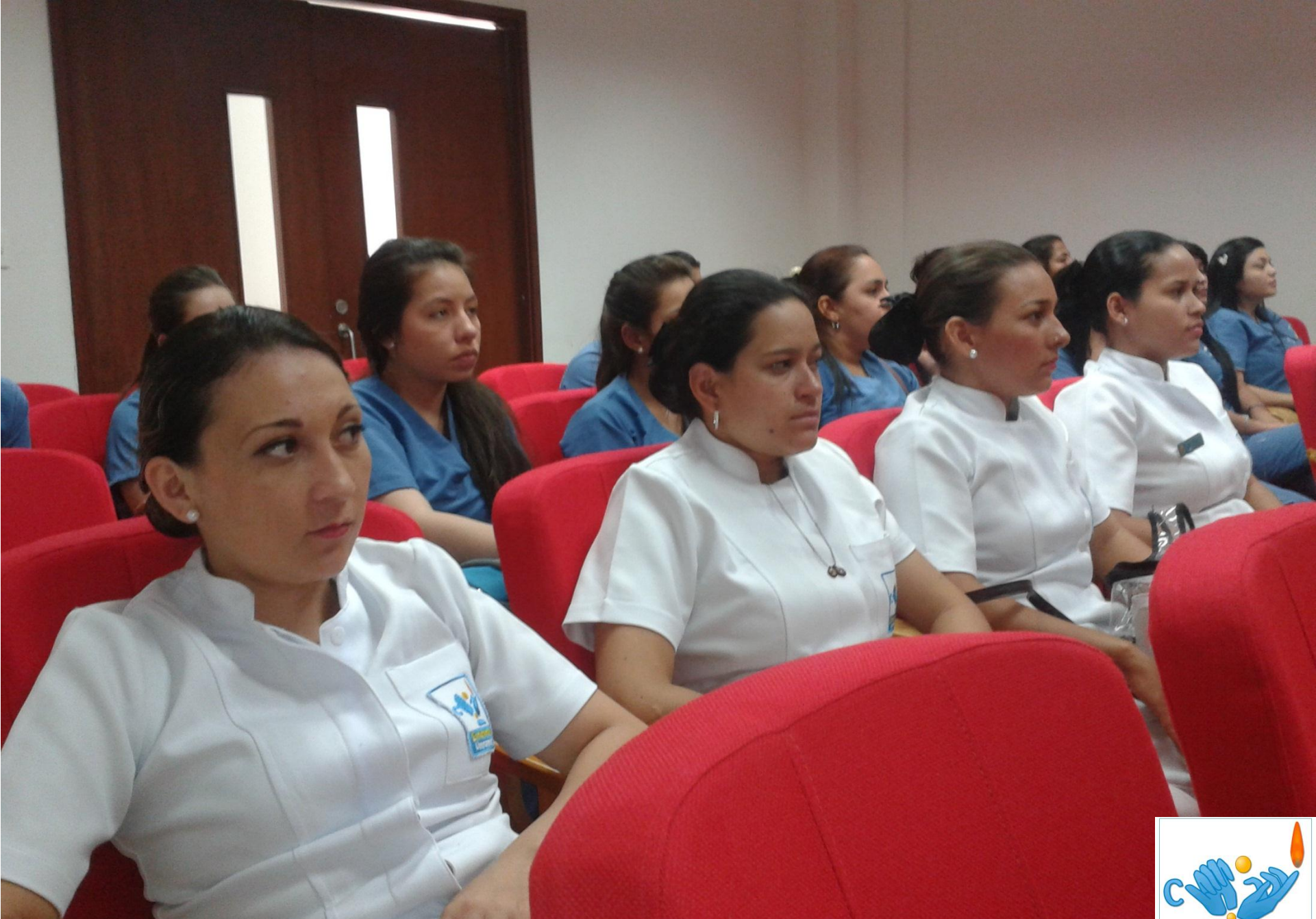
Inducción del Hospital Universitario Erasmo Meoz (HUEM)