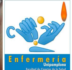
Inducción del Hospital Universitario Erasmo Meoz (HUEM)

ERASMO MEZ DEFINICIONES • Accidente de Trabajo es todo suceso repentino que sobrevenga por causa o con ocasión del trabajo y que produzca en el trabajador una lesión orgánica, una perturbación funcional, una invalidez o la muerte (Decreto 1295 de 1994 del Ministerio de Trabajo y Seguridad Social). • Enfermedad profesional todo estado patológico permanente o temporal que sobrevenga como consecuencia obligatoria y directa de la clase de trabajo que desempeña el trabajador, o del medio en que se le obligado a trabajar, y que haya sido determinada enfermedad profesional por el Gobierno Nacional. • Comité Paritario de Salud Ocupacional es el organismo de promoción y vigilancia de las condiciones de salud ocupacional dentro de la empresa.