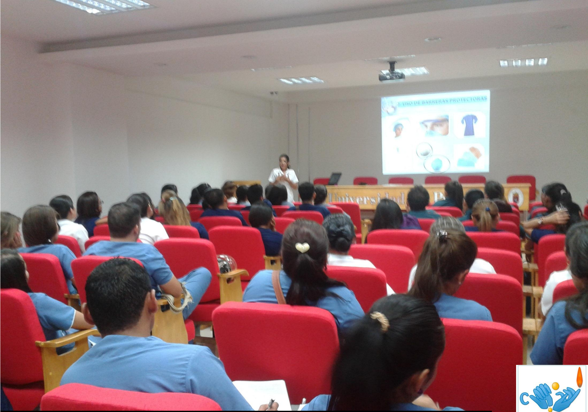
Inducción del Hospital Universitario Erasmo Meoz (HUEM)