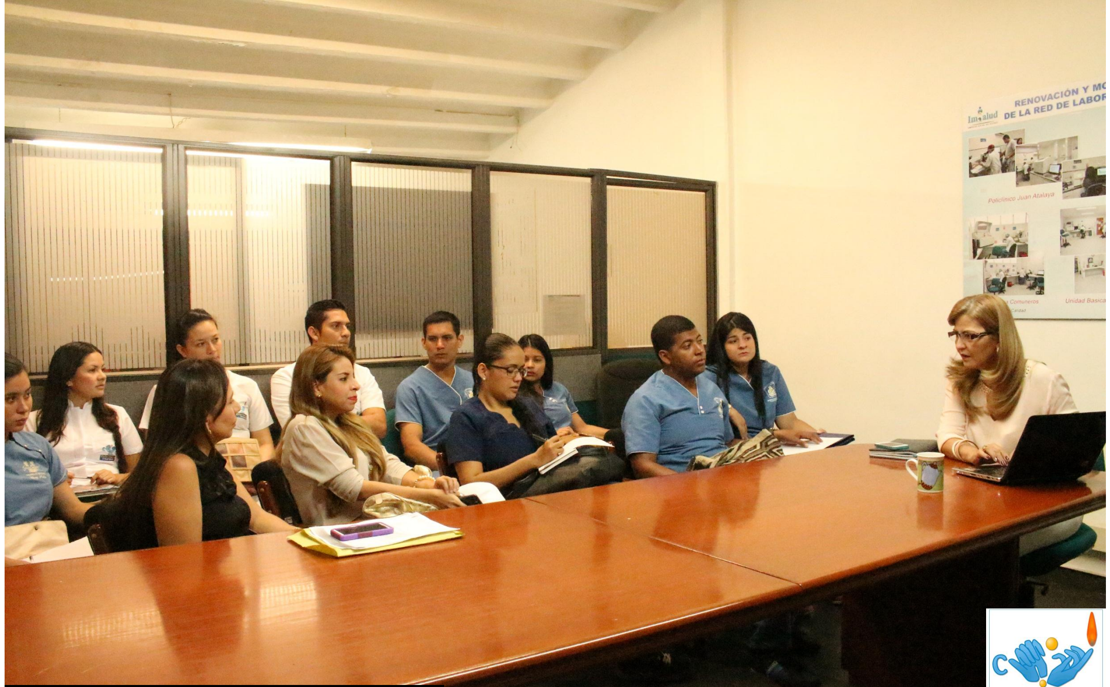
Inducción de CAP en Imsalud