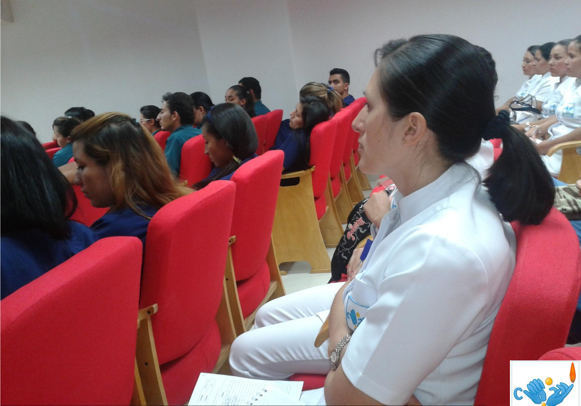
Inducción del Hospital Universitario Erasmo Meoz (HUEM)