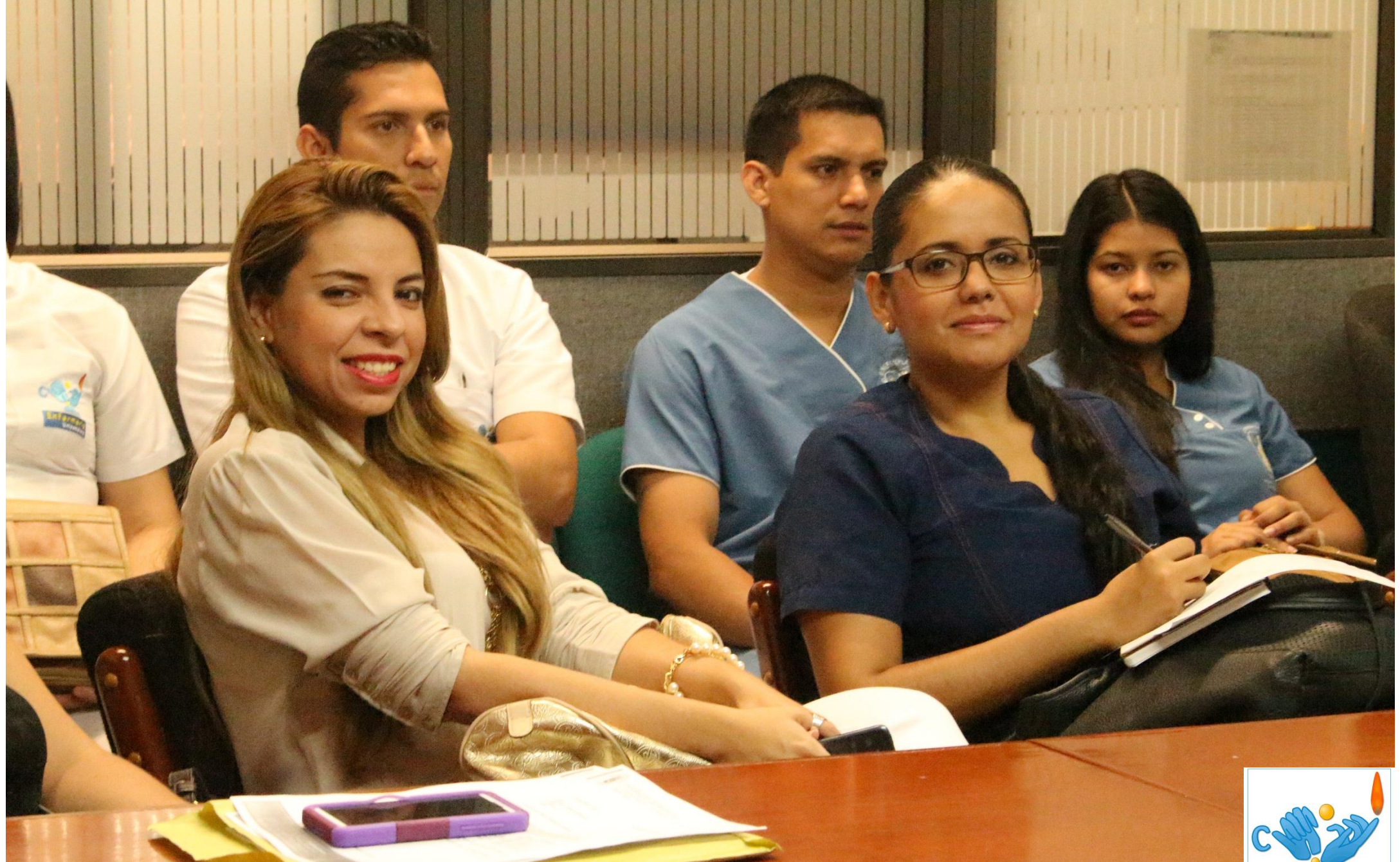
Inducción de CAP en Imsalud