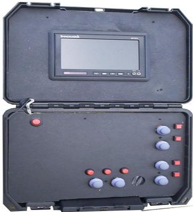
Fig. 8. Maleta de control

La central de control consiste en una valija muy pequeña y fácil de transportar. Es hecha en plástico resistente y en ella se encuentra una pantalla a color LCD TFT de 7 pulgadas, que permiten al operador observar las imágenes de las cámaras de video. A través de varios mandos analógicos (tipo joystick ) se tiene como función activar los motores del robot de forma independiente y simultanea si se requiere; además una serie de pulsadores permiten seleccionar la cámara, encender las luces y abrir o cerrar las pinzas.