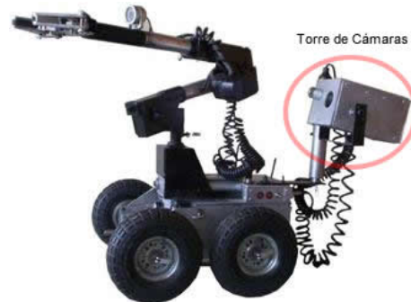
Fig. 6. Torre de Cámaras.

esto podría ocasionar errores o accidentes. La cámara tiene dos grados de libertad, 300 grados en la horizontal y 90 grados en la vertical (PT pan y til). En una versión futura se incluirá una cámara con zoom óptico (PTZ) más compacta. Complementando la función de la cámara de ataque se encuentra una lámpara de LED's, de bajo consumo. La torre de cámaras puede ser acoplada en 3 formas, la primera sobre el brazo telescópico de manera que se mueve en conjunto con el brazo en el plano horizontal, la segunda es la parte trasera del robot sobre una extensión mecánica plegable que la aleja del brazo articulado, proporcionándole mayor espacio de trabajo (Ver figura 6), y la tercera es en el centro del chasis en lugar de los brazos manipuladores.