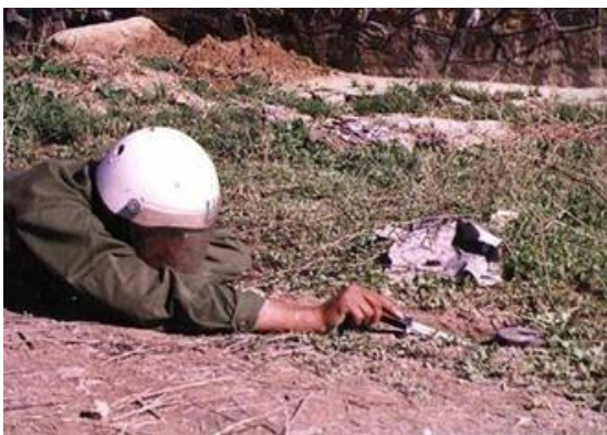
Fig. 1. Desactivación Manual de Minas Terrestres

Hoy en día estos escuadrones cuentan con una dotación de equipos y herramientas muy limitadas para atender estos casos de emergencia, y en muchos casos esta dotación no es la adecuada para manejar de forma óptima la situación de emergencia (Ver figura 1). Esto debido en parte a que la mayoría de sus equipos son donados por gobiernos extranjeros, en donde las características de sus conflictos son muy distintas y por esto los parámetros de diseño y funcionalidad difieren a los requeridos en el país.