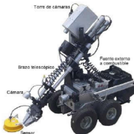
Fig. 4. Brazo telescópico con sensor de metales