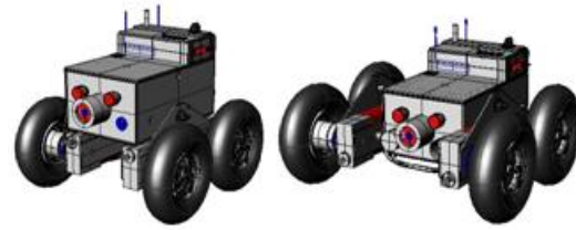
Fig. 3. Configuraciones del sistema de tracción diferencial

El sistema de tracción le permite al robot TMR1 desplazarse a una velocidad de 2 Km/h, proporcionándole un alto grado de maniobrabilidad en espacios cerrados. Gracias a ser un sistema modular configurable, el sistema de tracción puede ser acoplado en dos formas, la primera es una configuración mas elevada del suelo y mas angosta, que le permite maniobrar en espacios más reducidos pero reduce la capacidad de carga; la segunda forma es más ancha aumentando la base de apoyo y bajando el centro de gravedad del equipo, permitiéndole mayor capacidad de carga y estabilidad.