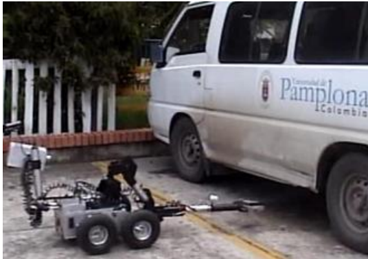
Fig. 5. Brazo Articulado inspeccionado vehículo.

completamente extendido, obligando al operador a transportar cargas pesadas lo más cerca posible al chasis para evitar que el robot se voltee. Otra tarea que se puede realizar con este brazo es la inspección por debajo de los vehículos (Ver ejemplo de la figura 5), en busca de cargas explosivas o cableados sospechosos (típicos en los carro-bombas), ya que su forma le permite plegarse sobre el mismo.