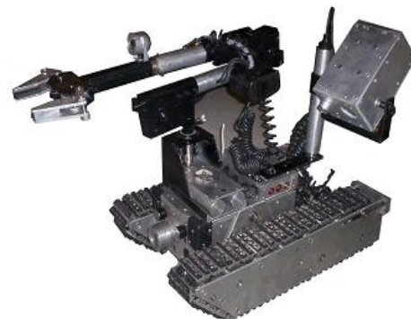
Fig. 7. Sistema de Orugas Intercambiables

Por la dificultad para subir escaleras con las ruedas obligo al diseño de un sistema de orugas intercambiables (Aun en desarrollo, Ver figura 7), que permitieran además desplazarse en terrenos irregulares de una manera más estable.