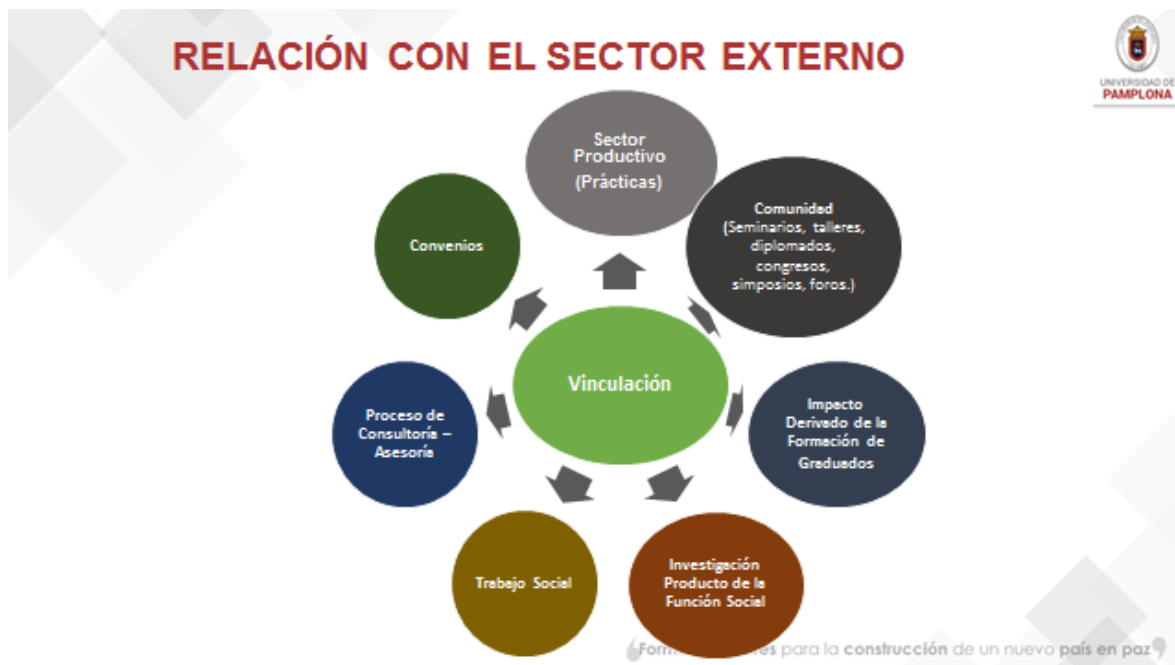
Figura 3. Mecanismos de relación del programa de Química con el sector externo.