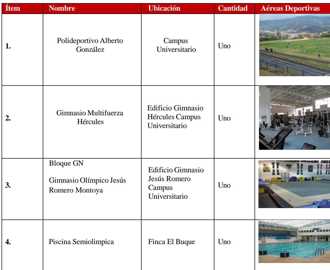
Tabla 14 Áreas de recreación/esparcimiento