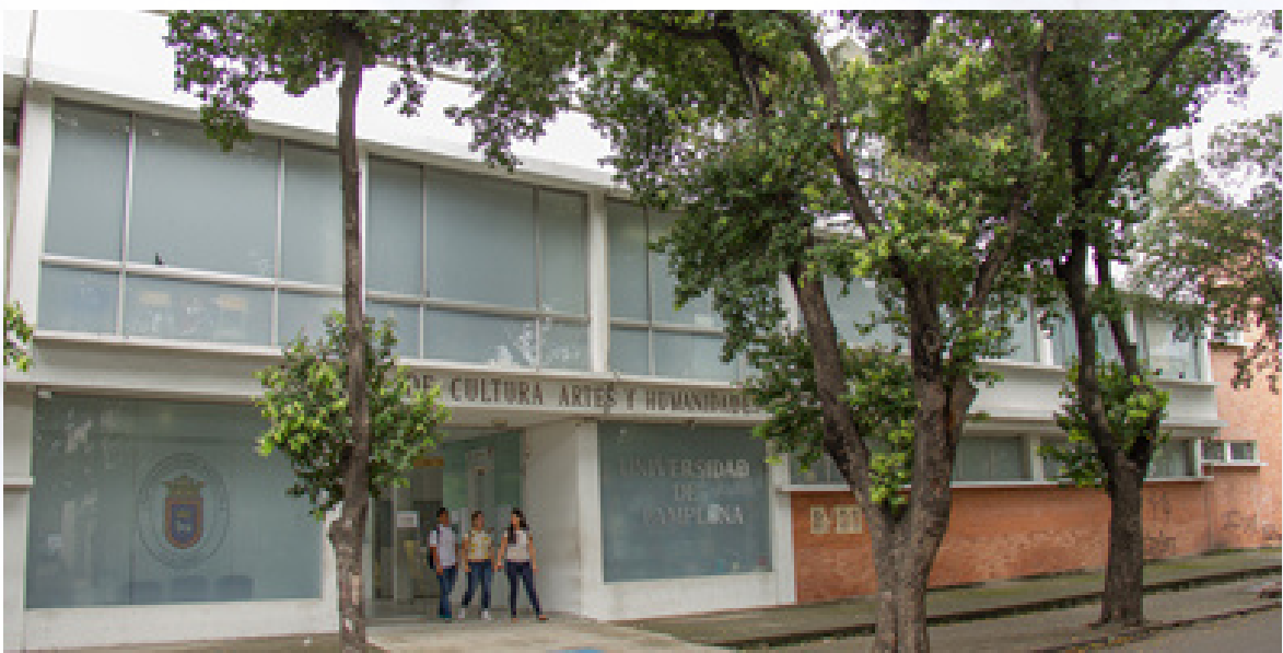
CAMPUS CREAD CÚCUTA