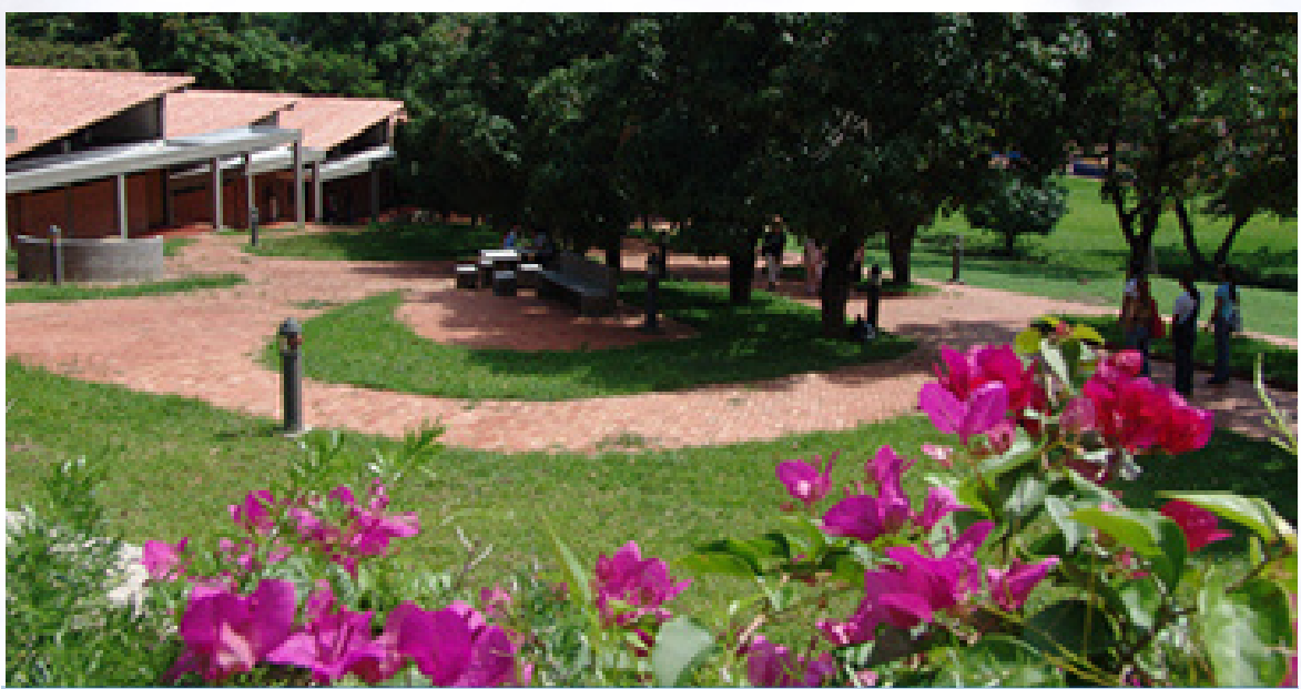
CAMPUS VILLA DEL ROSARIO