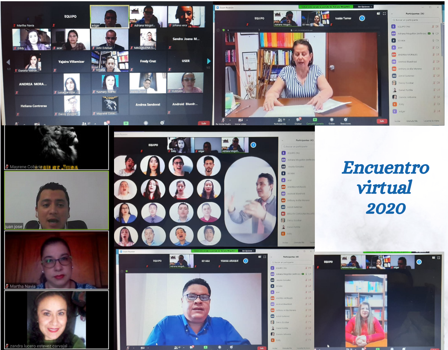
Encuentro virtual 2020

Presentación de experiencias significativas de nuestros egresados, se contó con el apoyo de los docentes y directivos del programa.