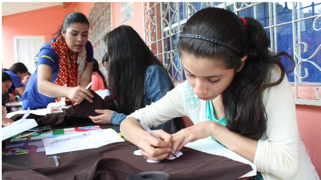
Las mujeres rurales elaboran productos que luego ofrecen en los mercados campesinos que organiza la administración municipal de Pamplona

El programa de Terapia Ocupacional de la Universidad de Pamplona a través de sus docentes y estudiantes continúan trabajando por el bienestar social de las mujeres campesinas de Pamplona en el marco del proyecto de interacción social "Arte terapia en la mujer rural", el cual es ejecutado con el apoyo de la secretaria de Desarrollo Social y recientemente con la Agencia Nacional de Infraestructura, ANI.