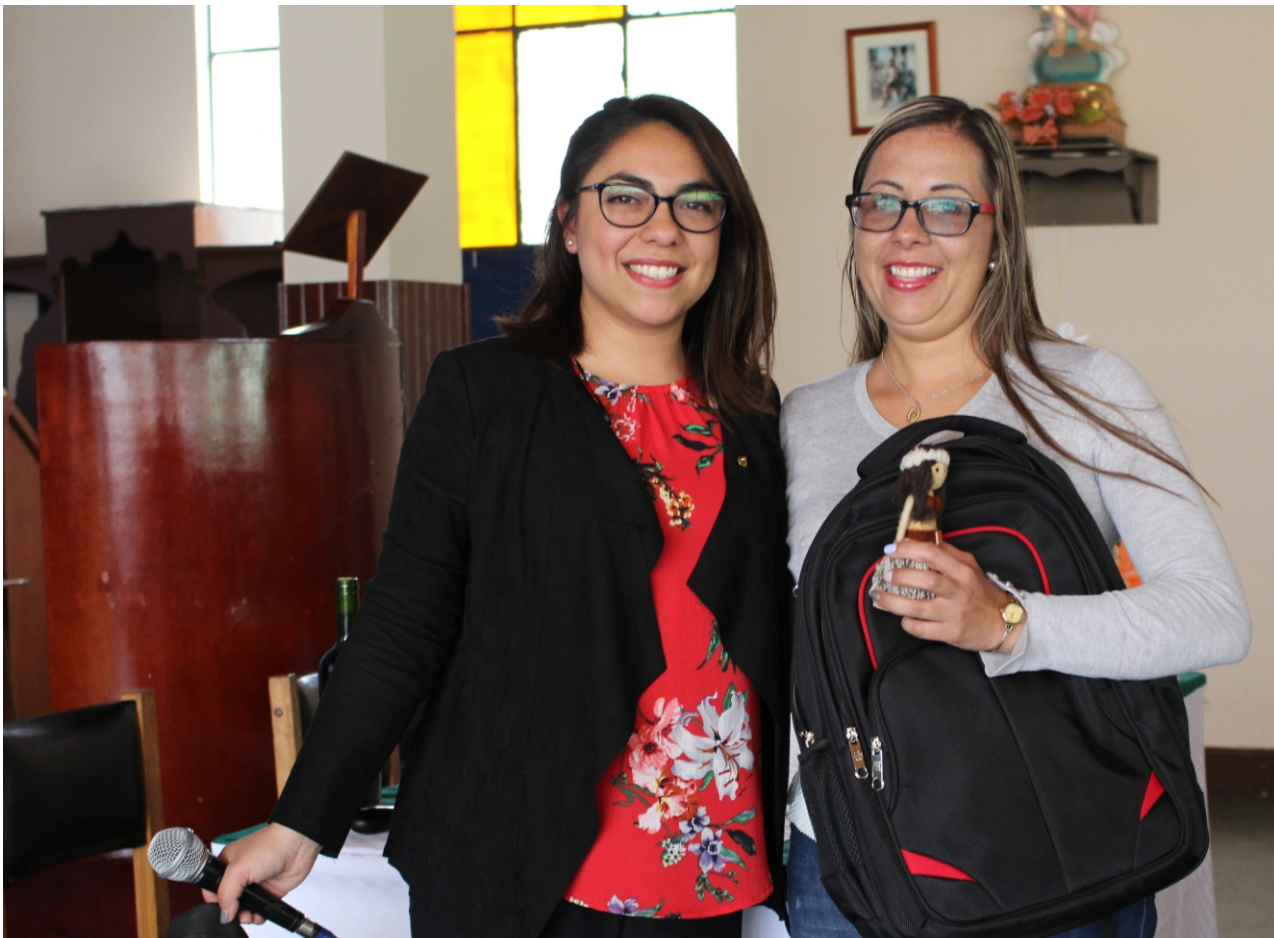
Las coordinadoras del programa de Terapia Ocupacional de la Universidad Viña del Mar le obsequiaron un vino y un morral a la directora de este departamento en Pamplona.