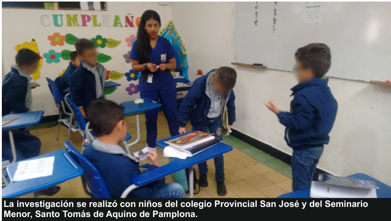
La investigación se realizó con niños del colegio Provincial San José y del Seminario Menor, Santo Tomás de Aquino de Pamplona.

Los morrales escolares podrían causar daños en la postura de los niños, esta fue una de las conclusiones de un estudio realizado en el colegio público Provincial San José y en el Seminario Menor, Santo Tomás de Aquino de Pamplona.