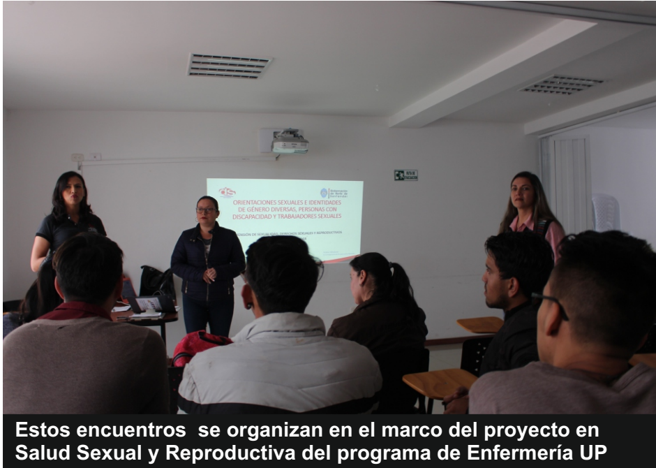
Estos encuentros se organizan en el marco del proyecto en Salud Sexual y Reproductiva del programa de Enfermería UP

El programa de Enfermería de la Universidad de Pamplona realizó dos encuentros por la diversidad y la inclusión con el fin de dar a conocer a la población temáticas relacionadas con la orientación sexual e