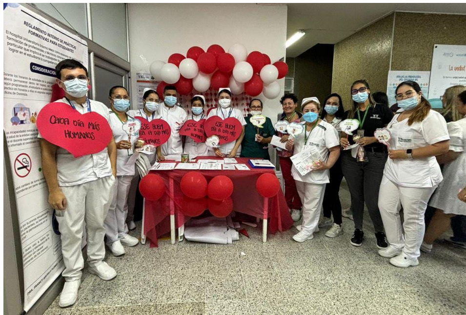
Estudiantes de enfermería junto al Stand realizando la actividad.

En el Hospital Universitario Erazmo Meoz (E.S.E HUEM) de Cúcuta los estudiantes de noveno semestre de enfermería realizaron la actividad “Despliegue de líneas estratégicas: humanización, docencia y seguridad del paciente”, en el que asistieron los programas de terapia ocupacional, fisioterapia, medicina y nutrición de la Universidad de Pamplona junto a la comunidad del Hospital universitario.